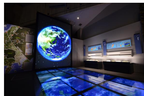
フォッサマグナミュージアム館内

※当日は、地球や日本列島の誕生をわかりやすく展示した、石の博物館「フォッサマグナミュージアム」（糸魚川市）から生配信します。