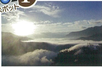
駐車場より徒歩:約5分