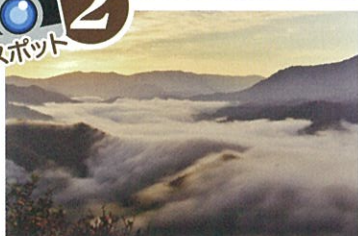
駐車場より徒歩:約15分