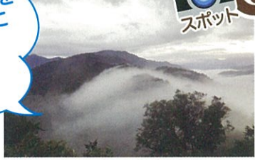
駐車場より車:約5分