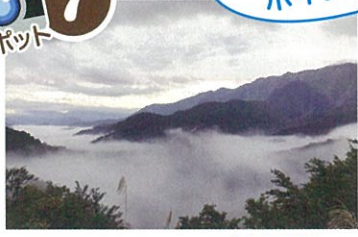
駐車場より車:約6分