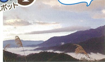
駐車場より徒歩:約6分