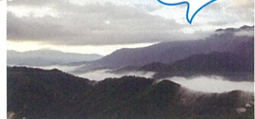
駐車場より徒歩:約3分