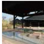
弥彦神社から車で5分～