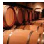
岩室温泉から車で20分

窓からは農業景観広がるカフェや、炊きたて握りたてのおむすびが楽しめる複合型直売所が人気。