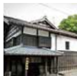
弥彦神社から車で5分～

標高634mの彌彦山を一気に駆け上がるロープウェイ。日本海には遠くに佐渡が浮かびあがります。