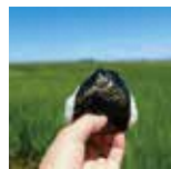
岩室温泉から車で15分

山麓の地下水で仕込む個性豊かな銘柄蔵元がズラリ。地域で長く愛される味をお楽しみください。