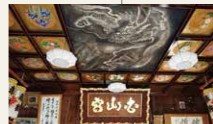
白山姫神社 天井絵