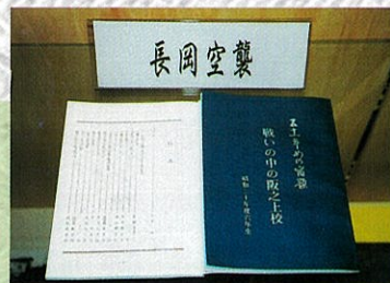
長岡空襲体験記 (昭和20年度卒業生)

長岡城の本丸は、今の長岡駅のところにあった。 17の城門と13の角櫓があり、侍とその家族が約8,500人も住んでいた。