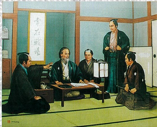
刀に手をかけて問いつめている 藩士たち