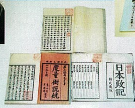
国漢学校の教科書