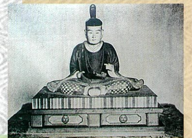
初代藩主牧野忠成