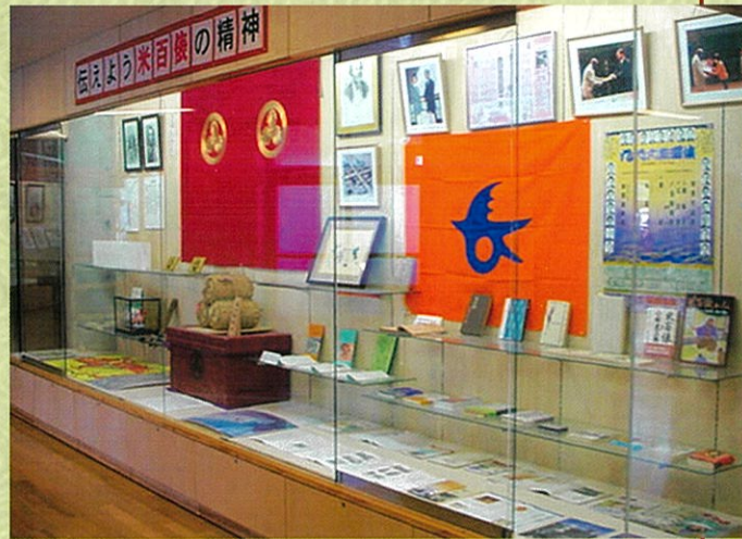
米百俵の精神を伝えるコーナー