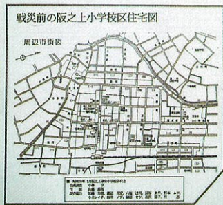
戦災前の阪之上小学校区住宅図 (昭和16年卒業生製作)