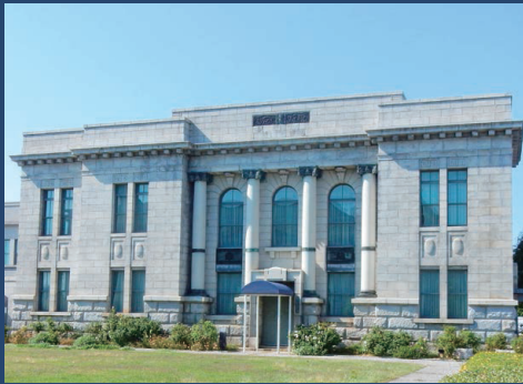
会場 / 旧第四銀行住吉町支店