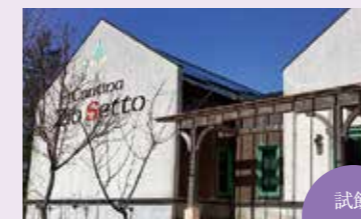
カンティーナ・ジーオセット

海岸砂丘である土地のテロワールを最大限に表現した風味豊かなワインが特徴。併設するショップでは、試飲も楽しめます。 data 新潟県新潟市西蒲区越前浜4501 tel.0256-70-2646