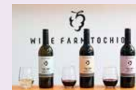
data 新潟県長岡市栃尾本町3-11 tel.0258-89-8960

マスカット・ベリーAなどの日本固有品種を生み出し、高品質なワインを提供する老舗ワイナリー。貴重な石蔵の見学や試飲を楽しめます。