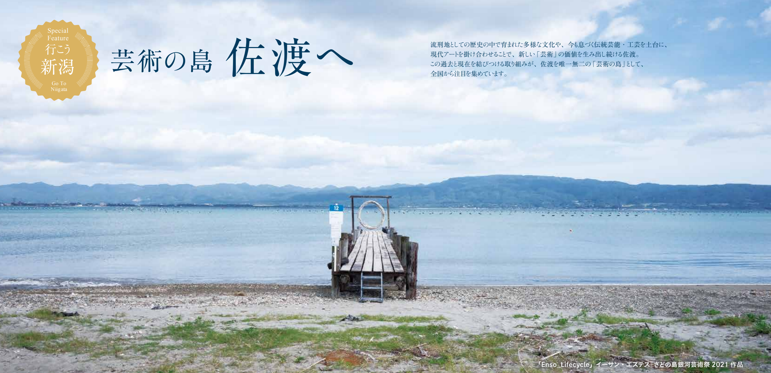
「Enso_Lifecycle」 イーサン・エステス | さどの島銀河芸術祭 2021 作品

流刑地としての歴史の中で育まれた多様な文化や、今も息づく伝統芸能・工芸を土台に、現代アートを掛け合わせることで、新しい「芸術」の価値を生み出し続ける佐渡。この過去と現在を結びつける取り組みが、佐渡を唯一無二の「芸術の島」として、全国から注目を集めています。