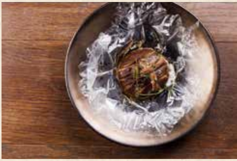
新潟県魚沼産八色椎茸のカルトッチョ 1,320円(税込)

カルトッチョとは食材を紙で包んで焼いた料理で、イタリア語では「紙包み」という意味です。「厚いにも、ほどがある」でおなじみの魚沼産の八色椎茸を使用しています。この椎茸の特徴である肉厚さ、ジューシーさは県内だけでなく、関東でも人気です。包み焼きにすることで椎茸の香りや旨みをぎゅっと閉じ込めています。秋はキノコがよりおいしい季節です。秋の味覚をぜひお試しください。