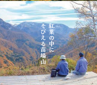
紅葉の中に そびえる苗場山