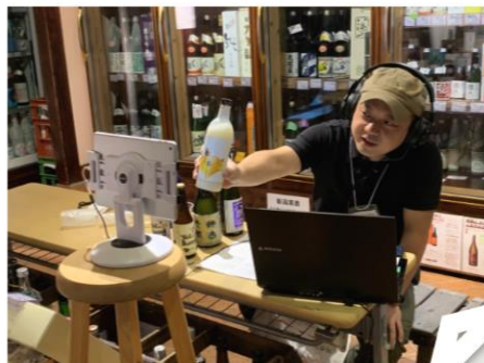
弥彦村からカンパ〜イ（羽生商店）

※近日中に公開予定 URL: https://niigata-kankou.or.jp/