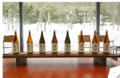
長岡市の酒蔵（朝日酒造）