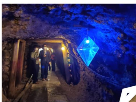
佐渡金銀山（アイランドミラージュ）