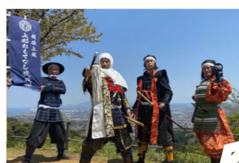
上越市から（武将隊）