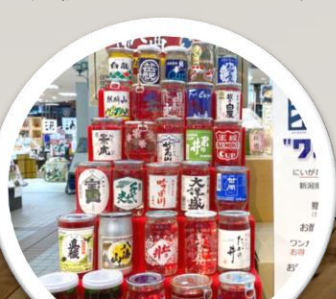
新潟の銘品が抽選で当たるプレゼントを実施しました♪