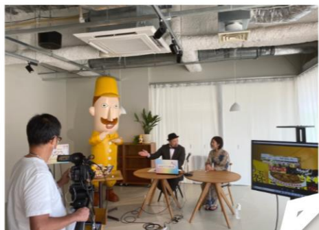
配信は新潟駅のMOYO RE : から行いました

7/24 (土) 25 (日) 2日間開催しました！！ 総勢1,778名の方にご参加頂きました