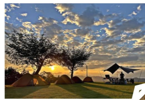
十日町市（清田山キャンプ場）