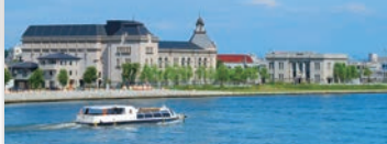
信濃川ウォーターシャトル(イメージ)

目の前にはのびやかに横たわる角田山。広大なぶどう畑に囲まれた一帯にカーブドッジワイナリーはあります。訪れた人々がワイン造りの現場に触れ、ワインやお料理を愉しみ、豊かな時間を過ごしていただけるような空間やサービスを揃えています。