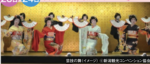
芸妓の舞(イメージ)