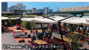
ピアBandai / ビーカンテラス(イメージ)

朱鷺メッセ31階地上約125mに位置する展望室。日本海側唯一の高さを誇り、新潟市街地はもとろん、日本海、佐渡島、五頭連峰などの360度のパノラマを楽しめるスポットです。