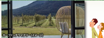
カーブドッジワイナリー(イメージ)