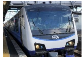
リゾートしらかみ「青池」イメージ