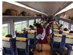
おもてなしイメージ

10月から「新潟県・庄内エリア プレデスティネーションキャンペーン」を実施しているところですが、キャンペーンのファイナルを迎えるにあたり、下記のとおり、沿線エリアによるおもてなし及びイベントを実施します。来年のデスティネーションキャンペーンに向け機運を高めていきたいと考えておりますので、是非、報道等で取り上げていただきますようお願いいたします。