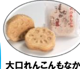
大口れんこんもなか