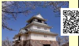
長岡市郷土史料館(有料)