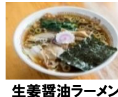
生姜醤油ラーメン

長岡藩初戦の地 榎峠古戦場パークや司馬遼太郎「峠」文学碑までは越後滝谷駅より徒歩約 45 分