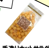
手造りホットサラダ