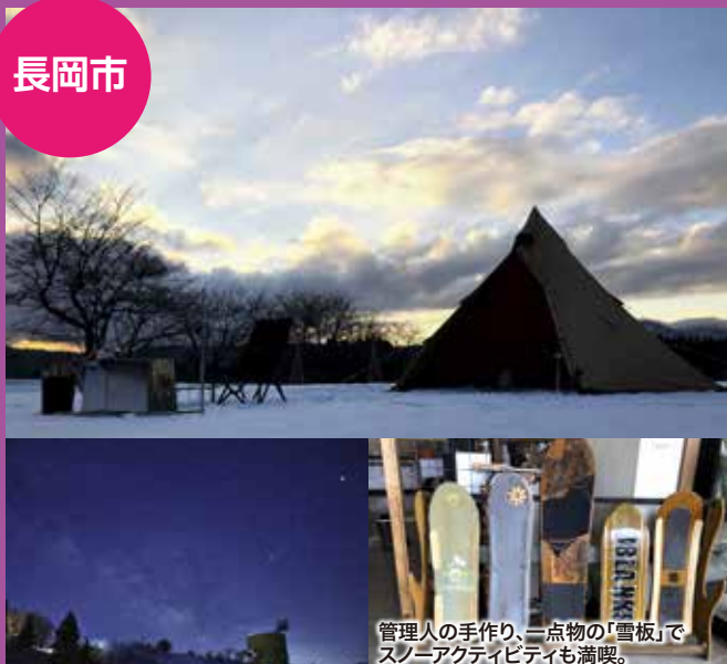
管理人の手作り、一点物の「雪板」でスノーアクティビティも満喫。