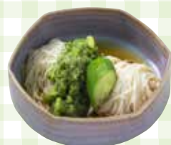
すりおろし胡瓜だれの さっぱりそうめん