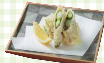
新発田産アスパラガスの生ハム巻き天ぷら