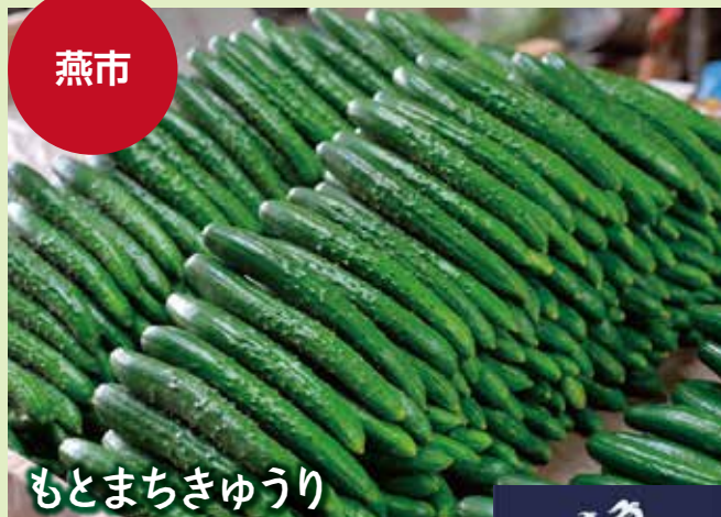
もとまちきゅうり

県内出荷量二位、最速最長級の出荷を誇るブランドきゅうりです。まるごと挟んだ「もとまちきゅうりサンド」など、地元飲食店が開発する変わり種メニューも要チェック！