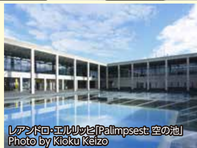
レアンドロ・エルリツヒ「Palimpsest: 空の池」