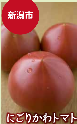
にごりかわトマト

県内生産シェアの6割を占める新潟市北区。二大産地である豊栄地区の「桃太郎」と濁川地区の「麗容」は、濃厚な甘さとちょうど良い酸味のバランスが絶品。北区の大玉トマトはこれから旬を迎えます！