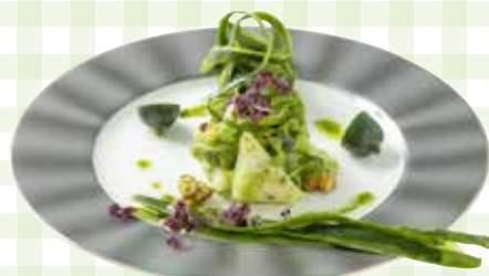
きゅうりと甲イカのマリネ

有名店の達人たち考案のレシピも掲載中♪ 「新潟ウチごはんプレミアム」も要チェック！